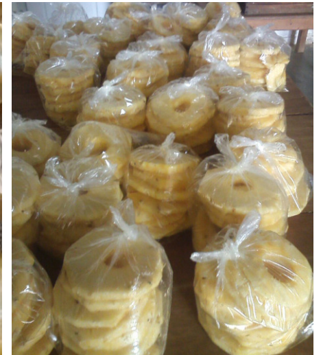
7. Piña congelada