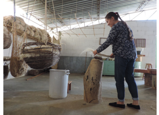
Manipulación de la fibra en el taller de papel