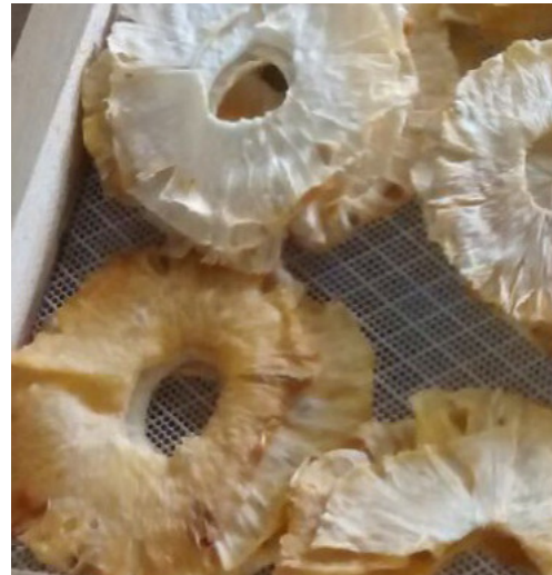
6. Piña deshidratada