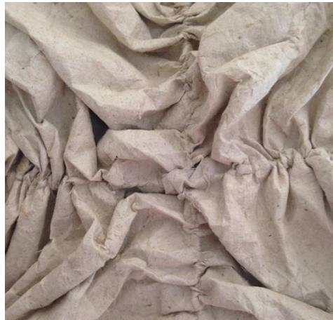
Textil de Piña