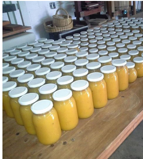
5. Conservas de Piña