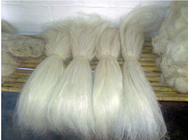
Fibra de Piña para hacer papeles y textiles