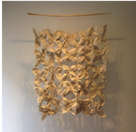
Papel de Piña con valor agregado