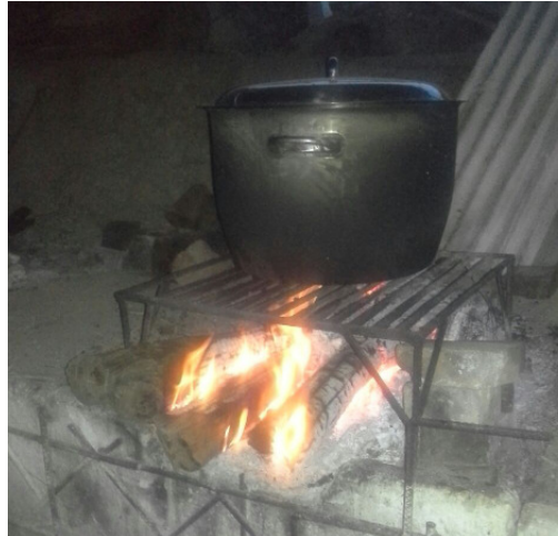
Cocción de la fibra