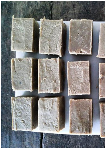
4. Jabón de Piña

3. La Fibra: Mujeres extrayendo fibra y pulpa de las piñas recogidas. Esta actividad se lleva a cabo en los talleres de múltiples oficios en Montechico.