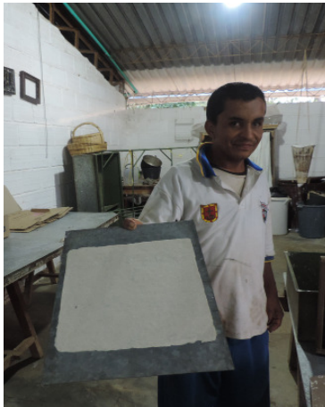
Papel de Piña